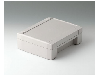
C8014182 SOLID-BOX 145 PC+ABS (UL 94 V-0) lichtgrau RAL 7035 180x145x60mm IP 66, IP 67, IK 08