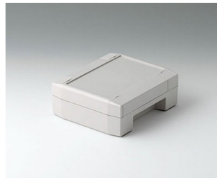
C8011132 SOLID-BOX 115 PC+ABS (UL 94 V-0) lichtgrau RAL 7035 135x115x50mm IP 66, IP 67, IK 08