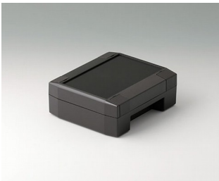
C8011131 SOLID-BOX 115 PC+ABS (UL 94 V-0) anthrazitgrau RAL 7016 135x115x50mm IP 66, IP 67, IK 08